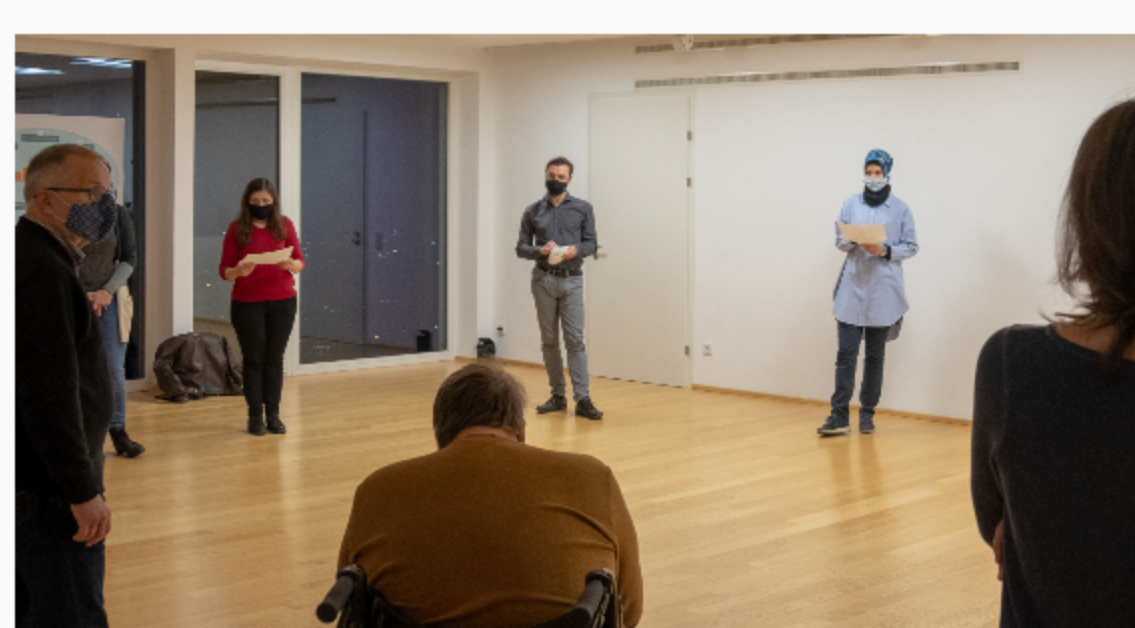
Unterstützungskreis als Arbeitsgruppe